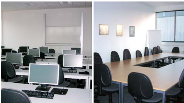
Schulungsräume am Standort Mönchengladbach (Stammsitz der Berufsbildungs-Akademie)

Wir bieten unseren Teilnehmern grundsätzlich an allen Standorten (Mönchengladbach, Krefeld, Neuss, Düsseldorf, Köln, Koblenz, Trier und Mayen) eine vorbildliche Infrastruktur.